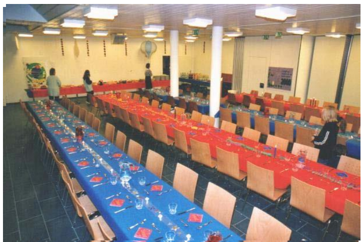
Der geöffnete Mehrzweckraum lädt zu Tisch: 150 Personen finden aufs Mal Platz